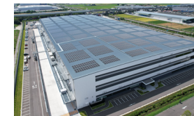
「DREAM Solar 愛知弥富(愛知県)」

※2 お客さまが保有する施設の屋根などを活用し、無償で再エネ発電設備を設置、発電した電気をお客さまの施設に提供するサービスモデル