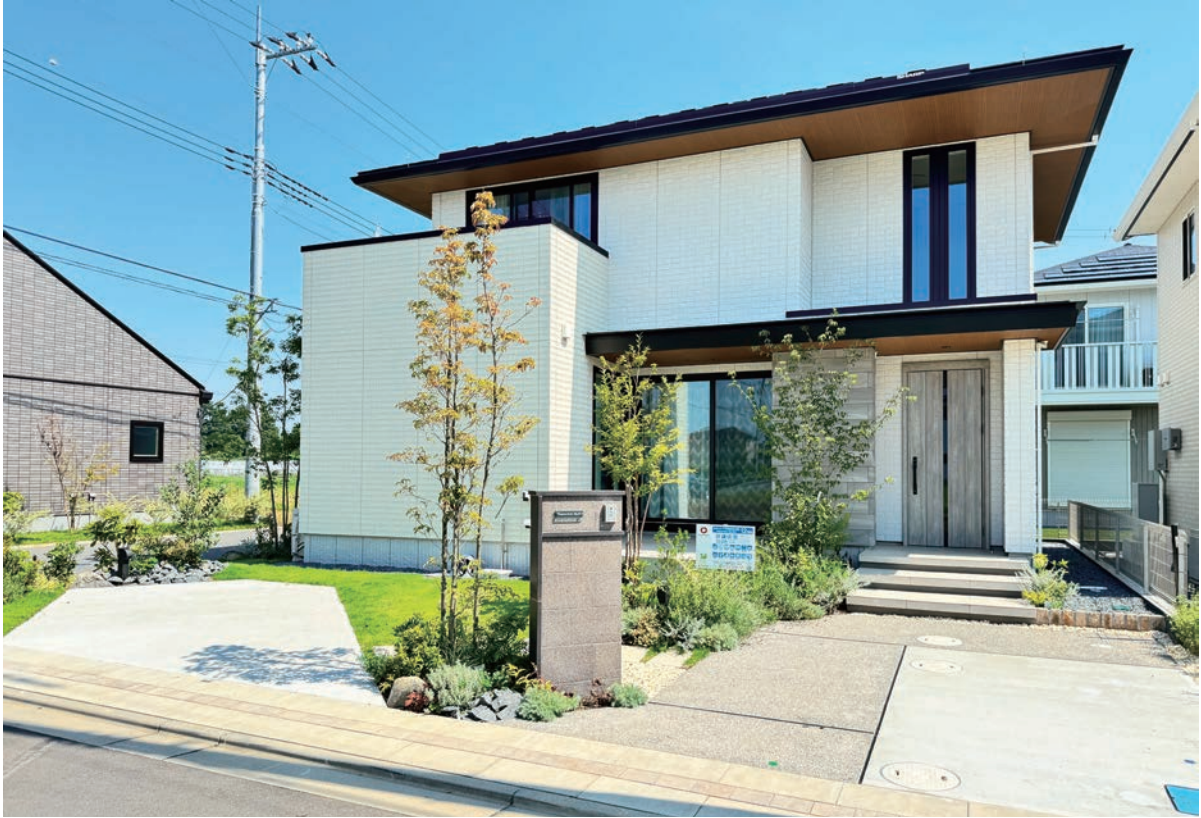
12号地外観写真(2024年9月撮影)

■敷地面積／181.90㎡(約55.02坪) ■延床面積／113.44㎡(約34.31坪) ■1F床面積／61.11㎡(約18.48坪) ■2F床面積／52.33㎡(約15.82坪)