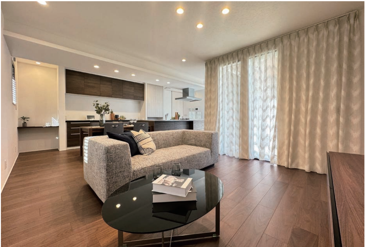
12号地内観写真(2024年9月撮影)