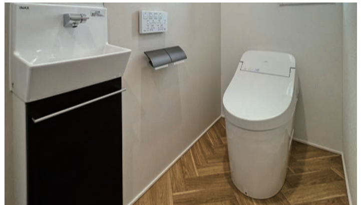
12号地内観写真(2024年9月撮影)